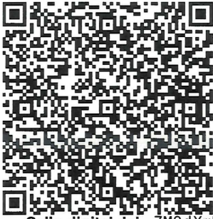
Sello digital del emisor

Subtotal 475.86 IVA 16% 76.14 TOTAL 552.00