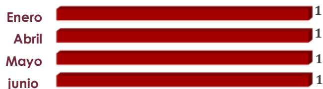
Gráfica que muestra el número de solicitudes recibidas por mes, durante el primer semestre 2016

A continuación se muestran las gráficas que muestran el resumen de recepción y atención de las 4 solicitudes de información: